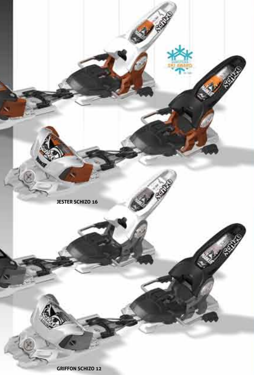
JESTER SCHIZO 16