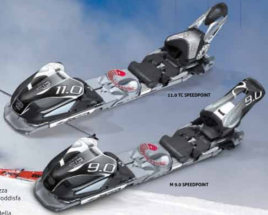
11.0 TC SPEEDPOINT