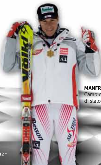
MANFRED PRANGER Campione del mondo di slalom del 2009

Una piastra per tutte le discipline: ora con più posizioni regolabili, come mai prima: l'altezza inferiore a 5 mm permette la centratura o il fissaggio della talloniera, cuscinetti scorrevoli o fissi, Front Spacer regolabili e l'opzione Duck Stance.