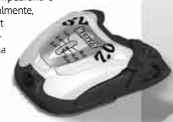
M 7.0 RTL

Tutti i sistemi RTL sono provvisti di sistema EPS, Biotech e piastra di scorrimento orientabile. Per il 2010 la guida metallica è stata rimossa dalla talloniera e adesso RTL offre gli attacchi Junior più leggeri del mercato.