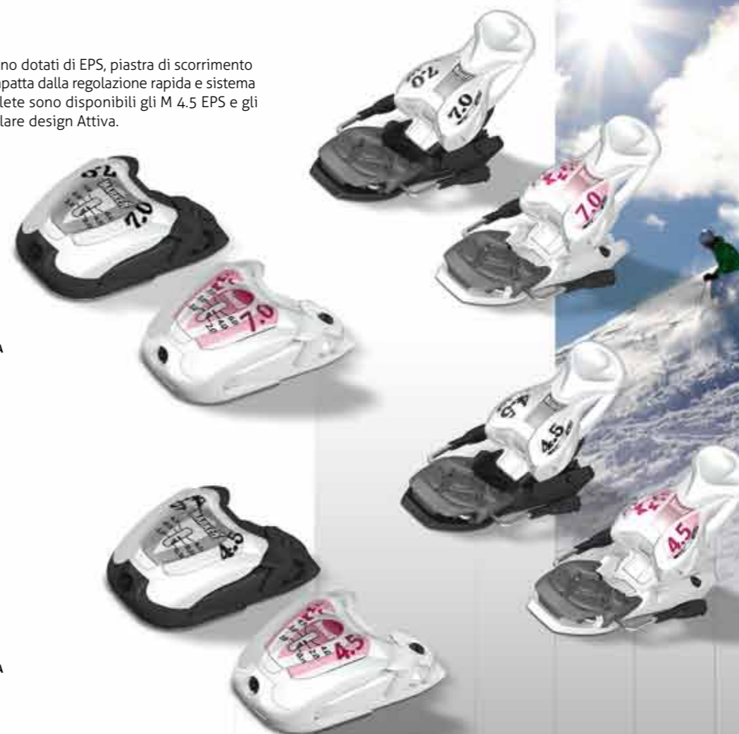
M 7.0 EPS

Tutti gli attacchi Junior sono dotati di EPS, piastra di scorrimento Active AFD, talloniera compatta dalla regolazione rapida e sistema Biotech. Per le giovani atlete sono disponibili gli M 4.5 EPS e gli M 7.0 EPS con un particolare design Attiva.