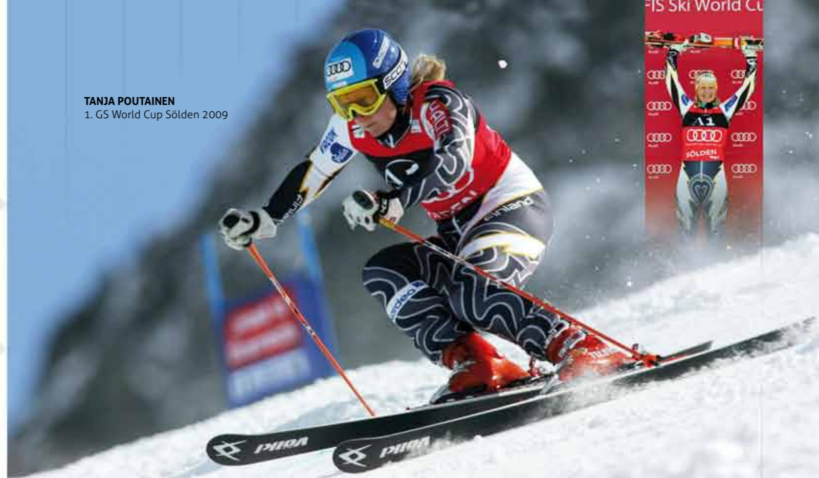
TANJA POUTAINEN 1. GS World Cup Sölden 2009