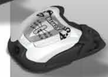
M 4.5 RTL