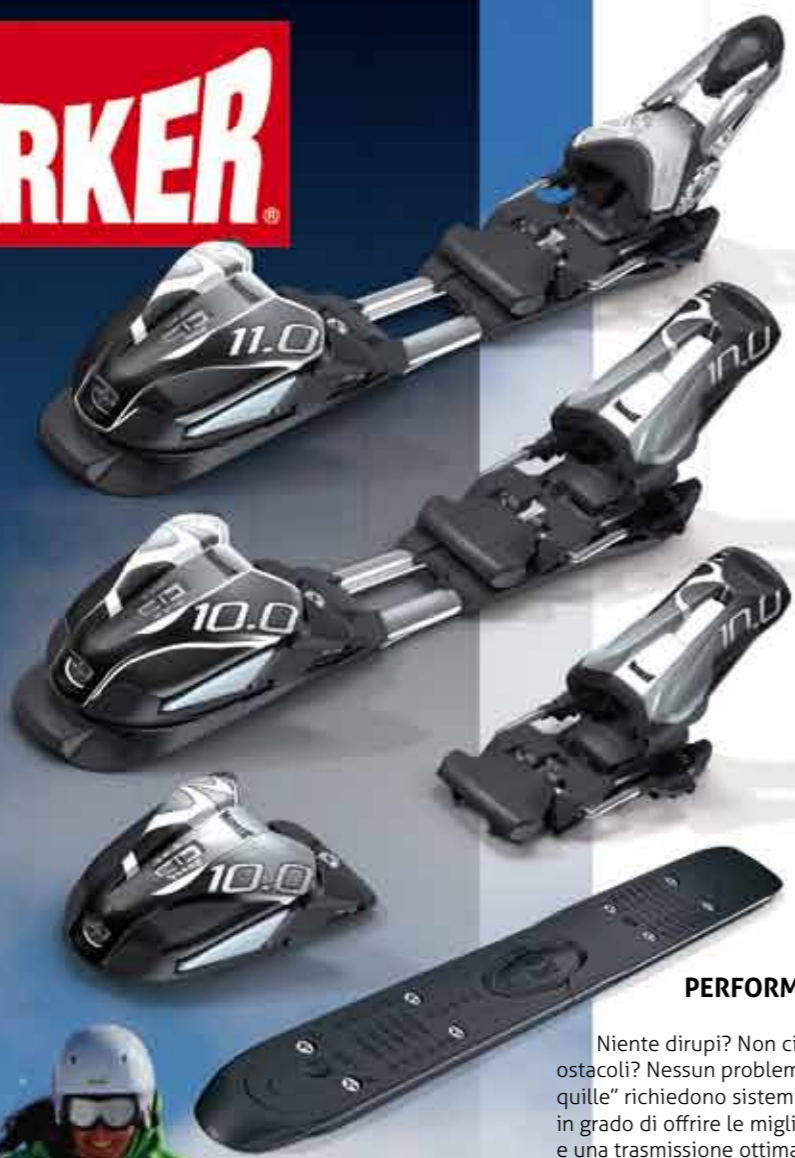
M 11.0 TC CC si