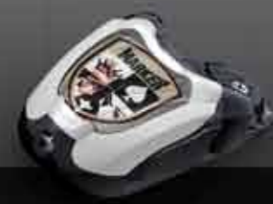
M 7.0 FREE